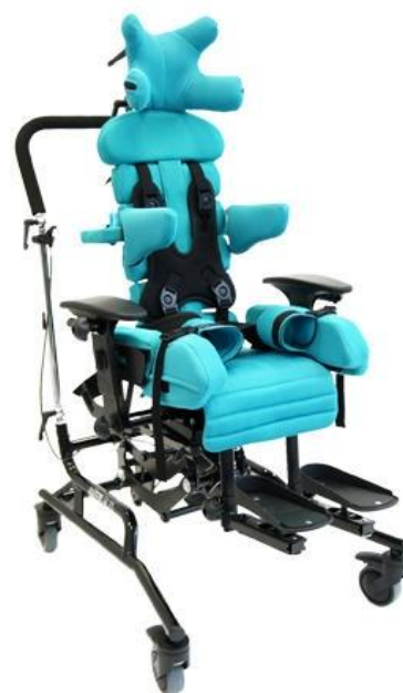
Abb. Enthält Zubehör