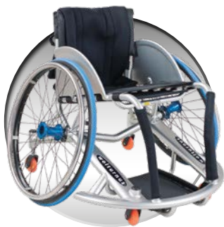
SPORT-ROLLSTÜHLE & FATBIKES